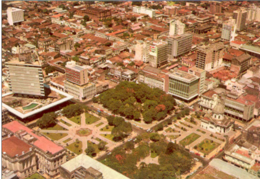
Luftaufnahme von "Eldorado-City"

ger als Deutschland. So lebt es sich laut "Spiegel-Online" in der eldoradischen Hauptstadt am billigsten von 144 weltweiten Ballungszentren. Hinzu kommt die totale Steuerfreiheit für nur im Ausland Gewinnerzielende.